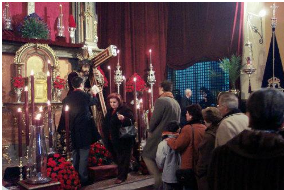
Jesús Nazareno de las Penas recibiendo culto, ya como titular de la Hermandad del Cristo de San Agustín